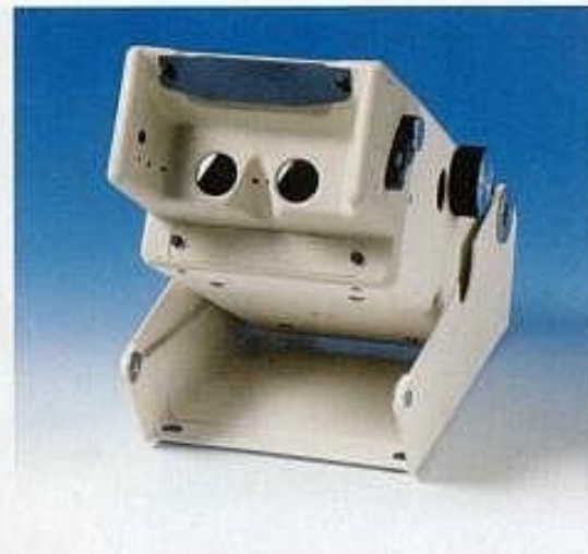
Sehtestgerät T2s als manuelle Variante

Speziallinsen für G 37: arbeitsplatzbezogener Sehabstand, (50, 67, 80, 100 cm Entfernung)