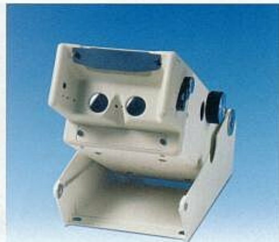
Sehtestgerät TITMUS 2 K

Das Sehtestgerät TITMUS 2 K ist tausendfach bewährt und überzeugt auch im harten Praxiseinsatz durch seinen robusten Aufbau und seine besondere Zuverlässigkeit.